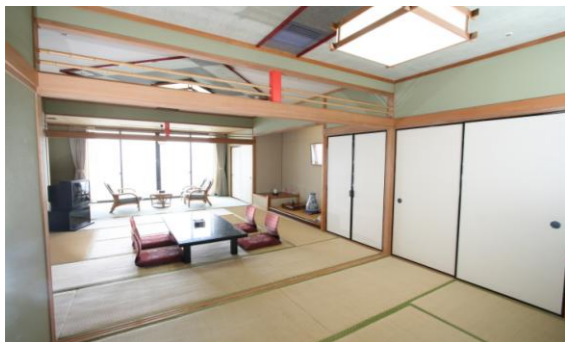
◇特別室(和室2間続き 12.5畳+6畳+広縁)

広々とした和の風情のお部屋でくつろぎ、長崎一の眺望を楽しむ。長崎でのステータスとして、ゆとりのご滞在を満喫してください。