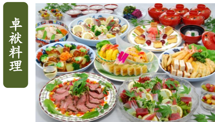
◇長崎卓袱料理「幕末の創作卓袱」