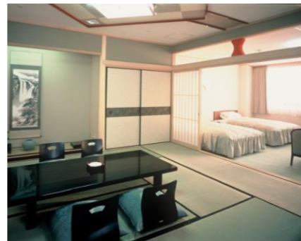
◇和洋室(10畳+ツインベッド)