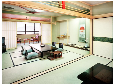
◇和室(和室2間続き 10畳+6畳)