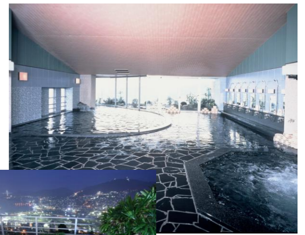
◇展望大浴場(サウナ付)

大浴場、露天風呂からは長崎市街が一望でき、翌朝9時まで一晩中ご入浴いただけます。